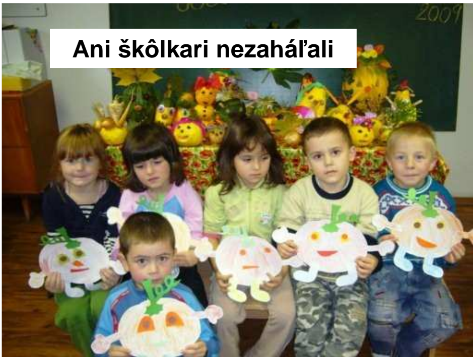
Ani škôlkari nezaháľali