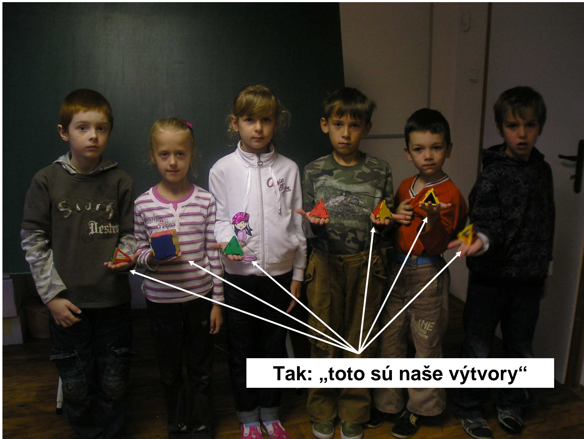
Tak: „toto sú naše výtvary“